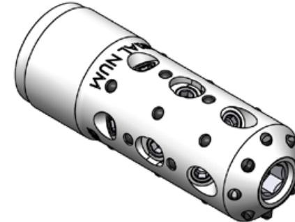
Punta lavadora tipo fresa Tamaño Ø2.060