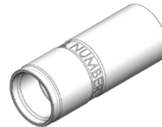
Camisa adaptadora con caja abajo 1.500 API REG