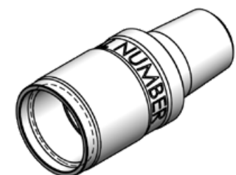
Camisa adaptadora con pin abajo 1.500 API REG