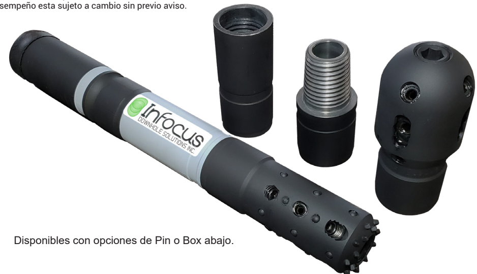
Disponibles con opciones de Pin o Box abajo.